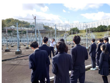
▲研究・科学分野の様子