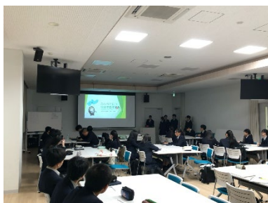
▲地域の諸問題分野の様子