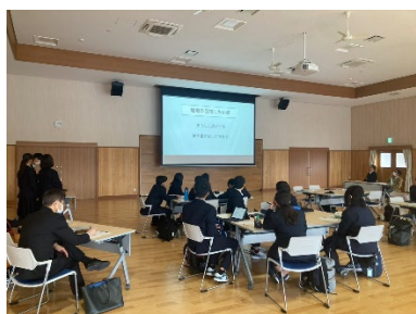
▲地域ネットワーク分野の様子