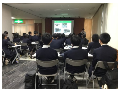
▲医療・福祉分野の様子

今後は、現地研修で得た情報も含めて、さらに考察を深め、発表資料としてまとめていきます。期末考査終了後にはクラス発表会を行い、各分野やクラスの代表を決定し、12月17日（火）に「碧水ホール」で学年発表会を行う予定です。