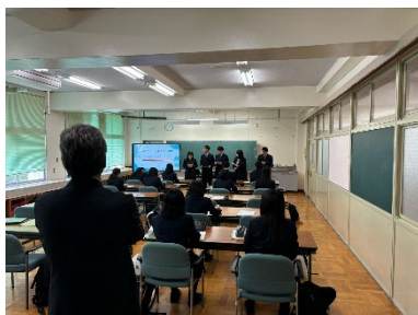
▲教育・心理分野の様子