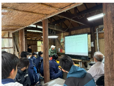
▲森林・生物分野の発表の様子