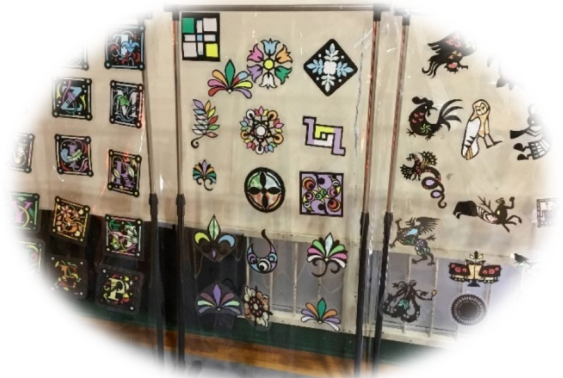
↑1年生文化チーム制作ステンドアート

1学期を通して、学校生活にも早く慣れ、全体的に楽しんでくれているようでした。授業中は多くの生徒が真剣に取り組み、努力できていました。普段の生活では明るくにぎやかで、大きな笑い声も絶えず聞こえていました。2学期も仲間を大切にしてチーム1年生で成長して行ってほしいと願っています。