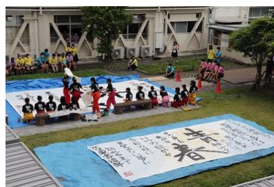
▲書道部のパフォーマンス

中庭では、有志グループの発表が行われました。いつもと違う一面や、コツコツと重ねた練習の成果が見られ、文化祭を大いに盛り上げてくれました。