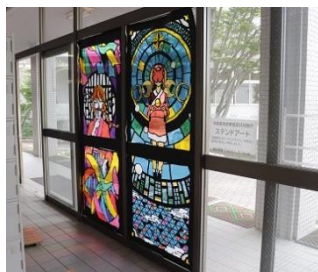
▲美術部のステンドアート