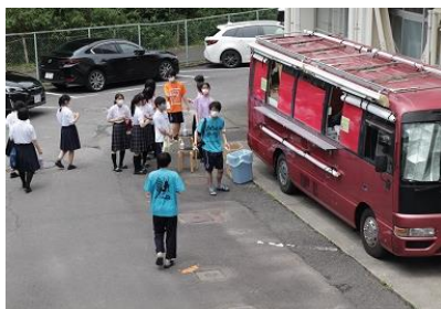
▲キッチンカーの様子