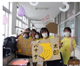
▲高3 ミニシアター（準備期間）

文化部の発表も、今年は全校での鑑賞はできませんでしたが、吹奏楽部の迫力ある演奏や合唱部の美しいハーモニー、書道部のかっこいい中庭パフォーマンスや演劇部の感動のステージなど、観た人を魅了してくれました。写真部、書道部、華道部、文芸部、ESSは日頃の成果を盛り込んだ作品展示を行い、美術部は作品展示に加えてステンドアートを制作し、昇降口を飾りました。科学部、コンピューター部は体験型のイベントを、茶道部は自身で立てるお茶会体験を行いました。