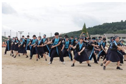
▲集団演技のようす（青団）

天気も味方してくれたようで、片付けをして教室に戻ったら雨が！！梅雨の晴れ間を思いっきり楽しむことができ、無事東風祭を終えることができました。