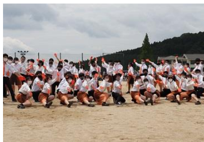
▲集団演技のようす（オレンジ団）