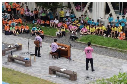
▲中庭ステージ（有志発表）

また、今年初めての企画としてキッチンカーによる軽食の販売も行われました。美味しいスナックやデザートを味わって楽しみました。